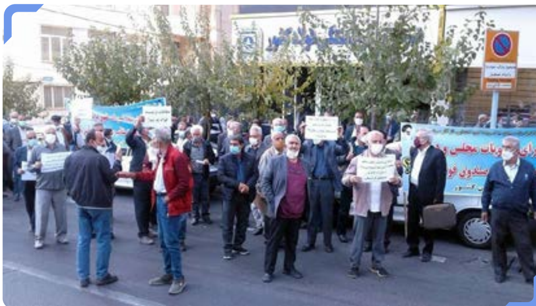
بازنشستگان صندوق فولاد

دولت در دهه‌های گذشته با سرکوب دستمزدها، نپرداختن بدهی و تعهداتش به صندوق‌های بازنشستگی، به ویژه تأمین اجتماعی، تهاثر بدهی با سهام بنگاه‌های زیان ده، تحمیل بیمه‌های اجباری به تأمین اجتماعی بدون آنکه سهم بیمه دولت را پرداخت کند و کاهش بودجه رفاه اجتماعی، سازمان تأمین اجتماعی و صندوق‌های بازنشستگی تحت پوشش آن را در شرایط «خطرپذیری» قرار داده است. بدهی دولت به سازمان تأمین اجتماعی به بیش از ۳۴۰ هزار میلیارد تومان رسیده است. دولت اما در قانون بودجه پرداخت تنها بخشی از این بدهی را در یک دوره زمانی پنج ساله متعهد شده است. بخش بزرگی از بدهی دولت به تأمین اجتماعی به عنوان بزرگترین صندوق بازنشستگی و بین‌نسلی به روال گذشته قرار است با واگذاری سهام بنگاه‌های دولتی یا فروش امتیازهای ویژه مانند تأمین خوراک پتروشیمی برای بنگاه‌های سازمان تأمین اجتماعی پرداخت شود؛ شیوه‌ای که در دو دهه گذشته سازمان تأمین اجتماعی و بنگاه‌های وابسته به آن را به حیات خلوت گروه‌های سیاسی بدل کرده است.