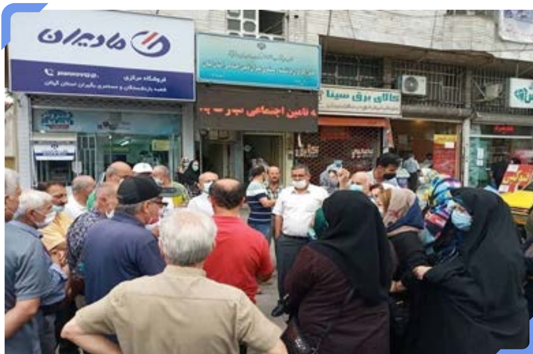
بازنشستگان تأمین اجتماعی

فقر تنها گریبان‌گیر سالمندان بدون بیمه نیست بلکه بازنشستگان تحت پوشش سازمان تأمین اجتماعی، صندوق بازنشستگی لشکری و کشوری، صنایع فولادی و چند صندوق خرد دیگر نیز به دلیل دریافتی اندک امکان تأمین هزینه معیشت خود را ندارند.