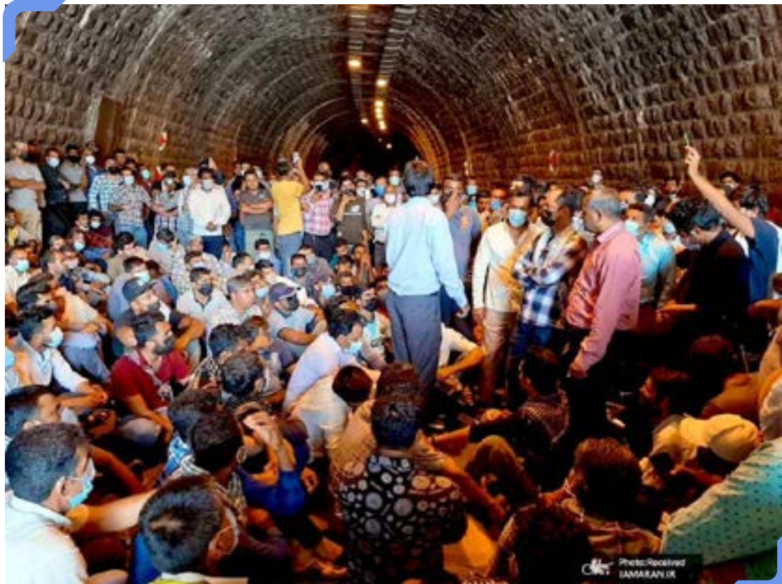
کارگران معدن آسمنون مسیر ارتباطی هرمزگان به کرمان را مسدود کردند

کسری بودجه در بخش دولتی و غیردولتی روز به روز بیشتر می‌شود. تأمین نشدن منابع پیش‌بینی شده در بودجه به دلیل کاهش شدید صادرات نفت بخش دولتی را در پرداخت حقوق و تأمین بودجه پروژه‌های عمرانی با مشکل روبرو کرده است. تأثیر این وضعیت بر معیشت کارگران تأخیر در پرداخت دستمزدها، کاهش دستمزد و اخراج بوده که اصلی‌ترین انگیزه‌های اعتراضی در محیط‌های کارگری به شمار می‌روند.